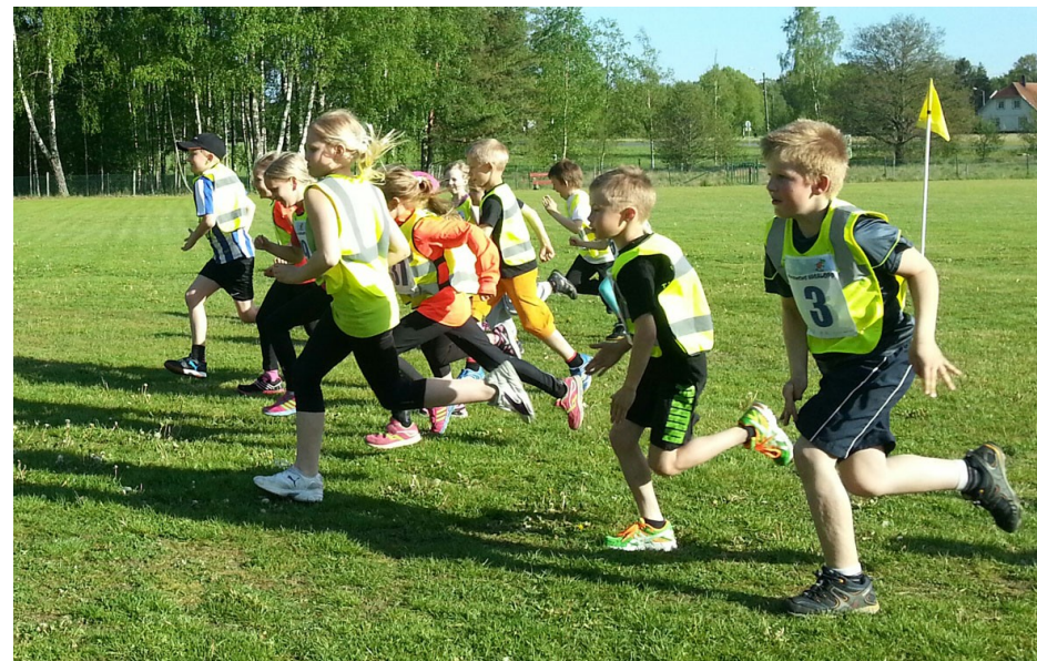
Barnen sprang åldersanpassade sträckor i det fina vårvädret.